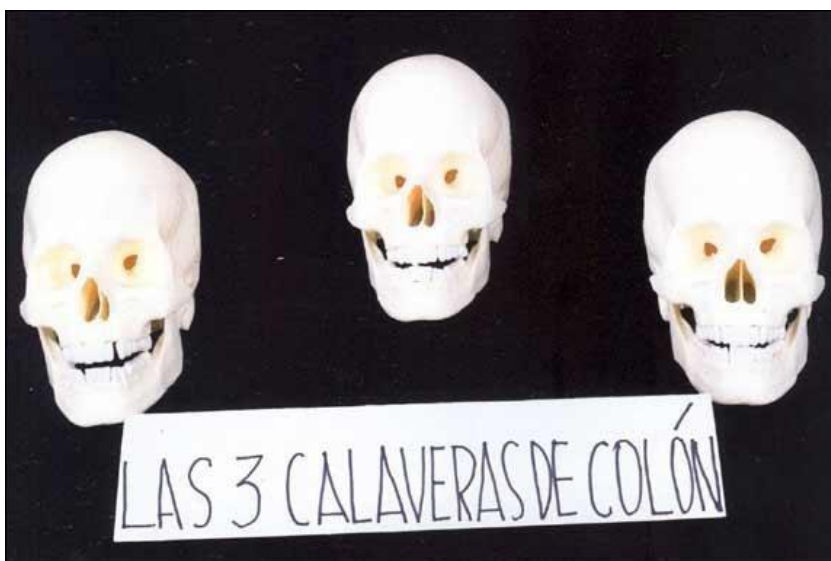
Nicanor Parra, “Las calaveras de Colón” 9

Parra, mediante el uso del humor negro y la risa, devela la conquista de la hispanidad como el dominio de la muerte por sobre los territorios de la indianidad precolombina. Así, el uso de la calavera, como símbolo de le genocidio pertenece como recurso estilístico a la tradición más nueva de la poesía (o antipoesía) chilena. Creemos que Huenún dialoga con estos juegos poéticos siniestros que develan el dominio del conquistador haciendo intertextualidades, referencias, vínculos que remiten, como afirmábamos antes, a una propuesta que reúna en un libro distintas zonas de interacción escritural poética en el diálogo, indio/hispano/chileno. Huenún reescribe la(s) historia(s) de su pueblo, recurriendo a la forma aglomerada del pastiche poético, forma de los tiempos contemporáneos, 10 o bien, forma de una lengua fragmentada por los duros tiempos de la conquista: