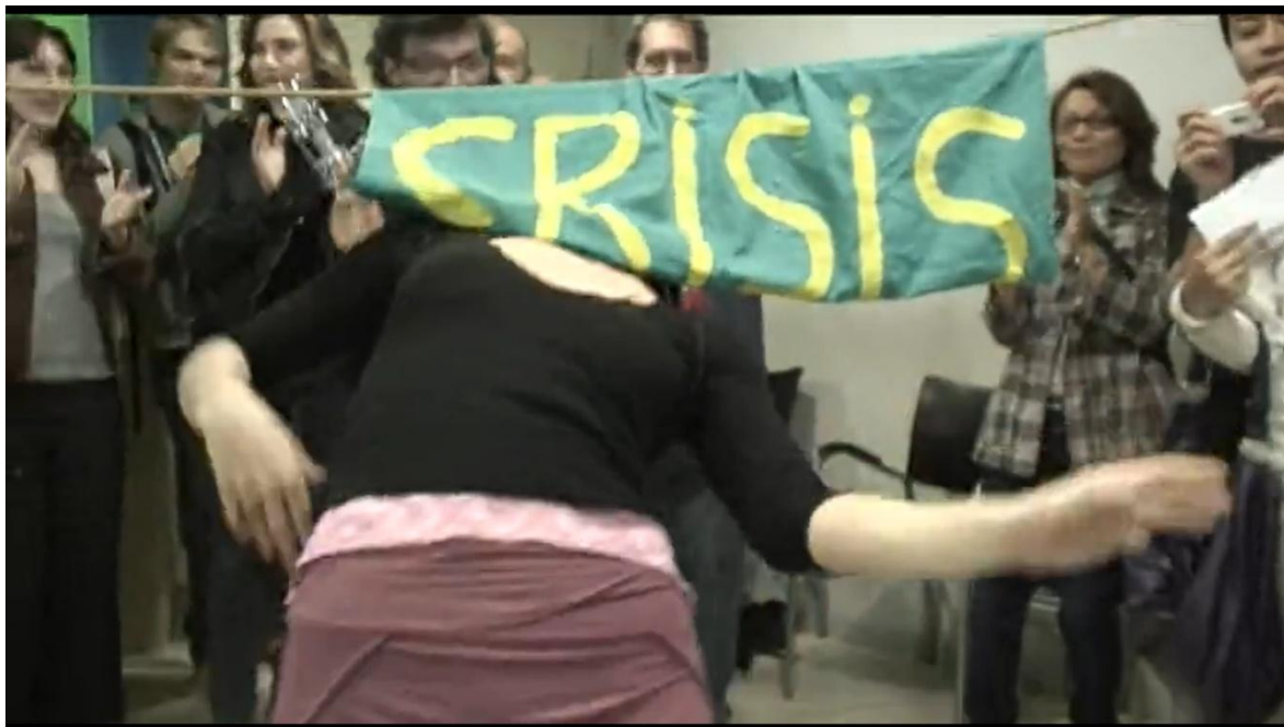
Imagen 3. Limbo a la crisis