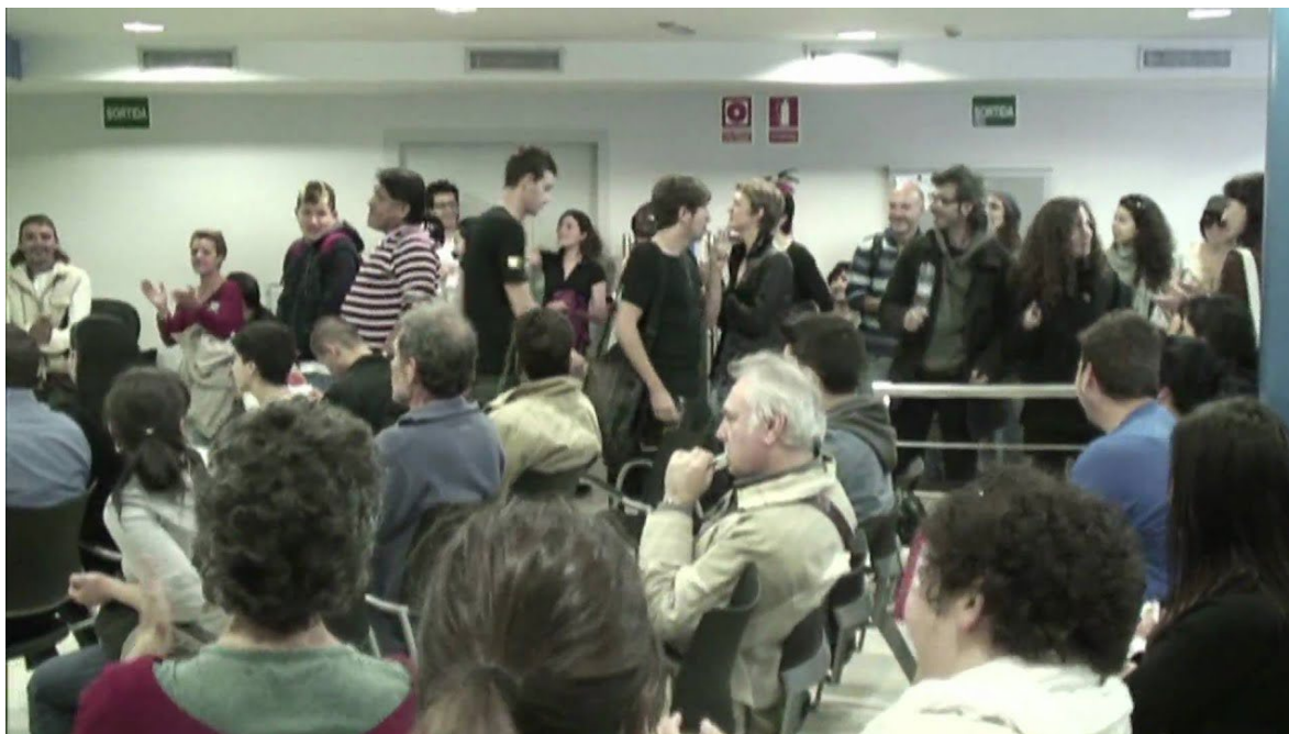
Imagen 2. Comienzo de la intervención en el INEM