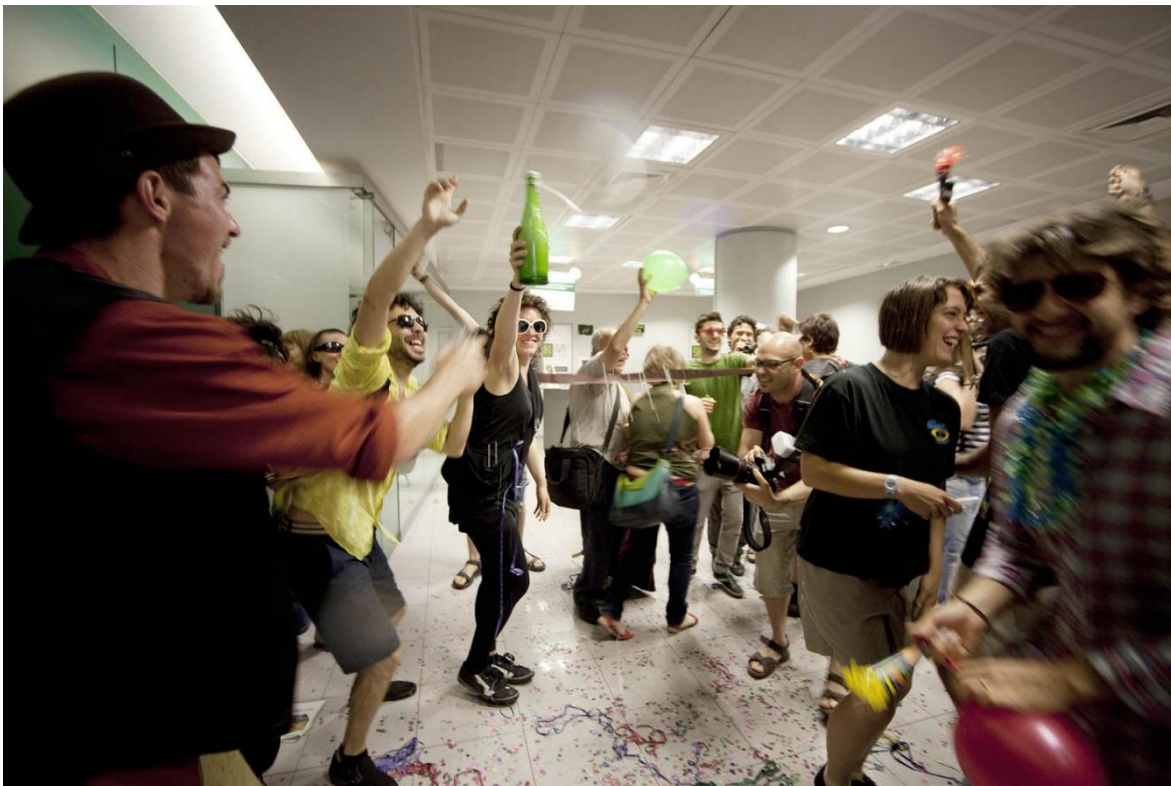
Imagen 5. Comienza la fiesta