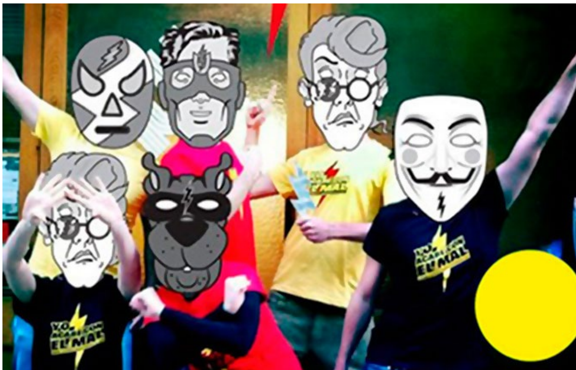
Imagen 1. Presentación del grupo